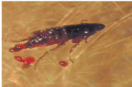
...der Floh sticht ...