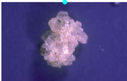
. und werden zu Puppen..