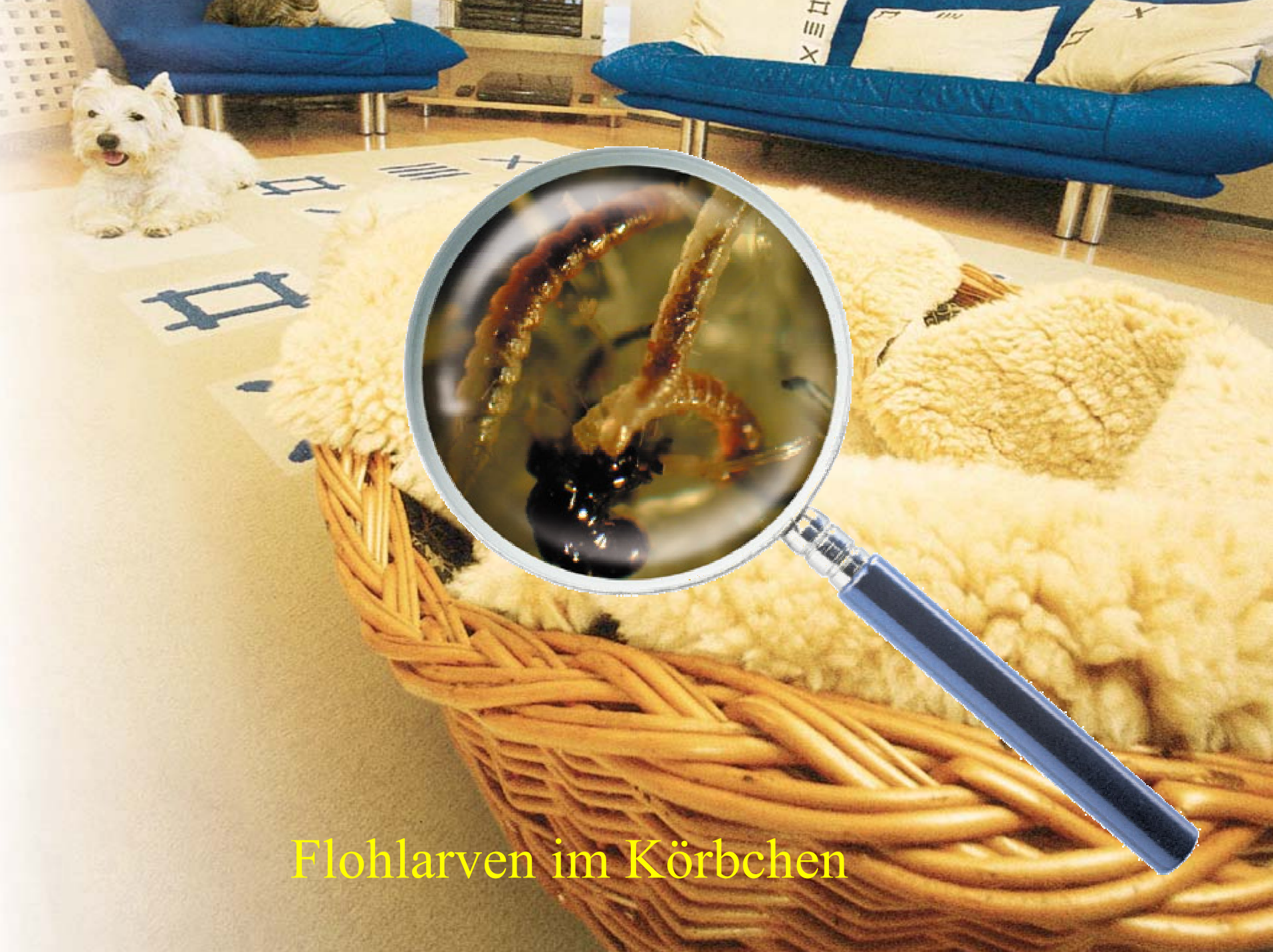
Flohlarven im Körbchen