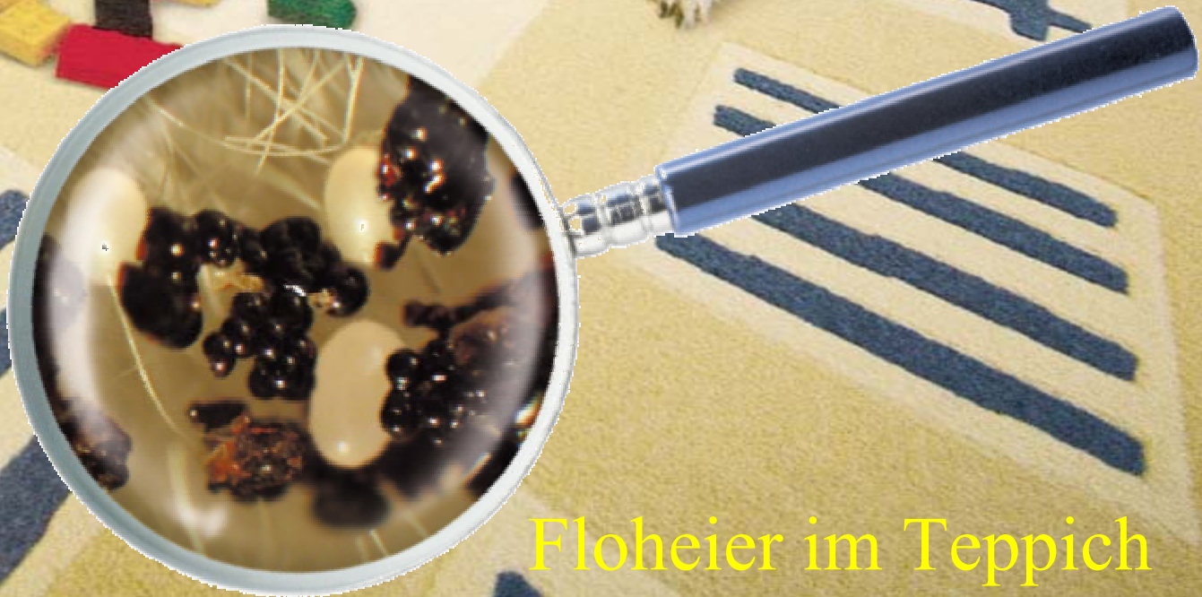
Floheier im Teppich