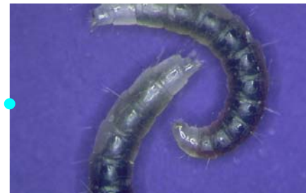
...Larven schlüpfen ...